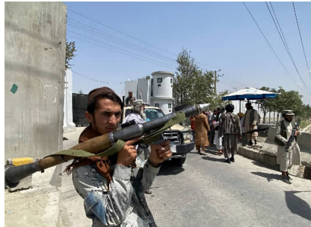
17日，一名阿富汗塔利班武装人员手持武器站在位于喀布尔的阿富汗内政部门口。

国际货币基金组织(IMF)18日宣布，暂时冻结阿富汗获得特别提款权等资源的渠道。