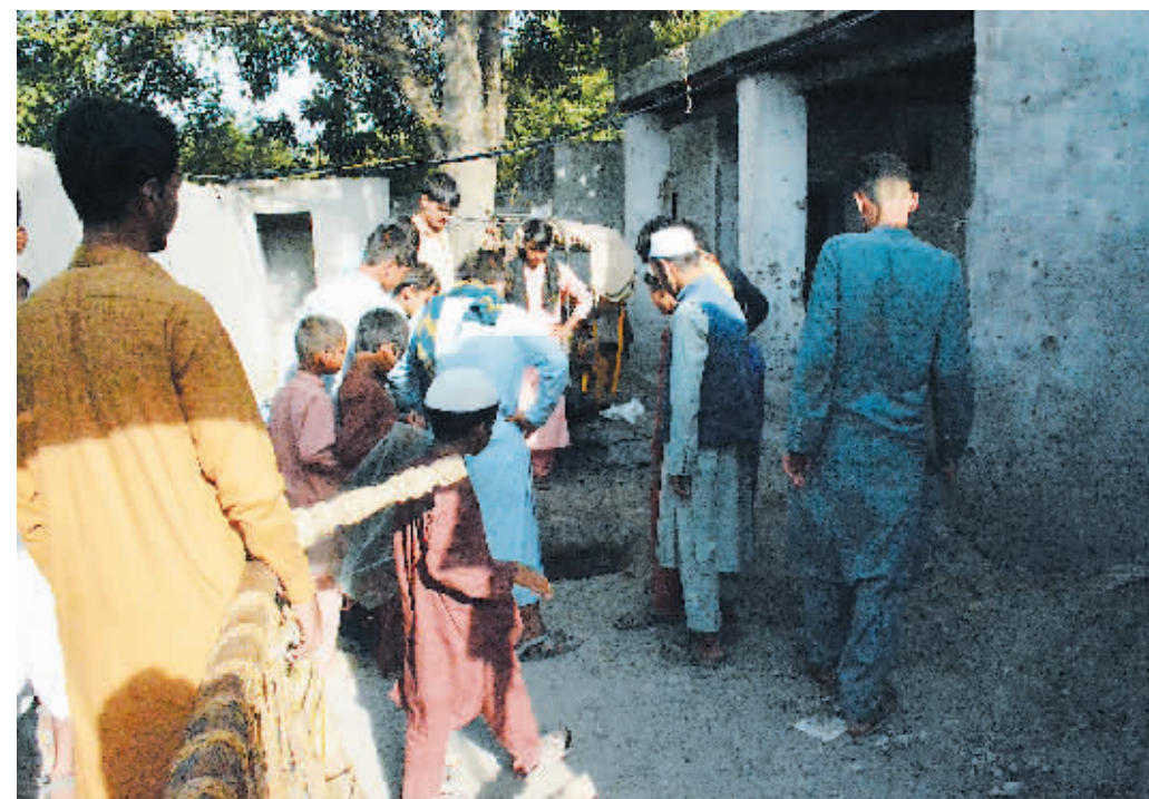
28日，人们聚集在阿富汗楠格哈尔省的空袭现场。

美国总统拜登28日说，美军方评估认为，未来24小时至36小时阿富汗首都喀布尔很有可能再次发生恐怖袭击。