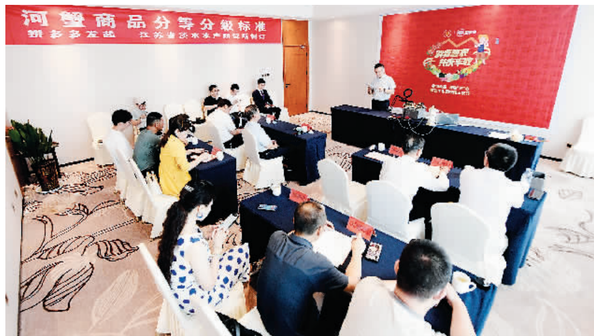
9月13日,江苏省淡水水产研究所联合拼多多正式发布了“长三角河蟹分等分级标准”

近年来,随着蟹市的线上线下产业高速发展,竞争愈发激烈,大闸蟹行业也出现了以次充好、蟹绳注水、