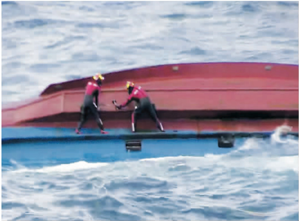
当地时间2021年10月20日,一艘72吨级韩国渔船在独岛(日本称竹岛)东北方向168公里海域倾覆。

据中国驻韩国大使馆21日介绍,20日因韩国渔船倾覆落水失踪的4名中国船员中,已有2人于21日早7时左右获救,由韩方直升机紧急送往郁陵岛上的医院接受治疗。