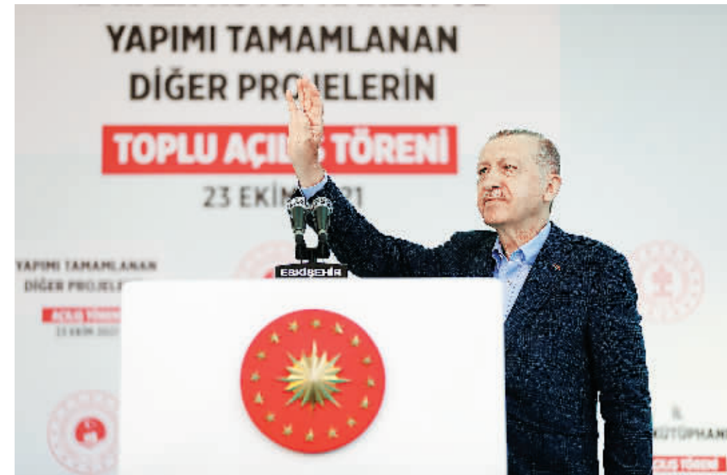
23日,土耳其埃斯基谢希尔,土耳其总统埃尔多安出席国家花园、城镇图书馆和其他项目的落成典礼。

土耳其总统埃尔多安23日说,他已下令土耳其外交部宣布美国等10国驻土耳其大使为“不受欢迎的人”。埃尔多安当天在土耳其西北部城市埃斯基谢希尔发表演讲时宣布上述决定。