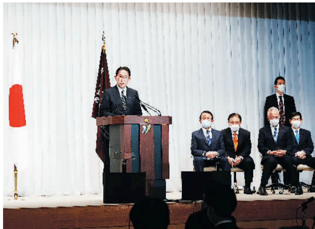
11月1日，日本东京，日本首相岸田文雄出席新闻发布会。

根据日本媒体1日凌晨公布的选举结果，联合执政的自民党和公明党赢得日前举行的日本第49届国会众议院选举，斩获席位大幅超过半数。