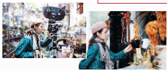
丙排、丁排 回流工艺品、古玩杂项、字画、文房四宝，在丙排、丁排都能寻到。如果说潘家园哪里最有复古风，您可以来这转一转。