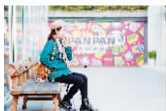
香潘潘美食街区 作为潘家园市场创新打造的东区集装箱香潘潘美食街区，中西特色美食一应俱全！在这里，逛吃一个都不能少。