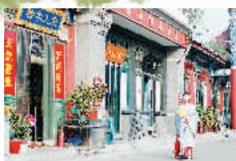
甲排、大棚一区、二区 文玩珠宝、玉石摆件、手工艺品、印章石料。传统的文玩产品在这里都能找到。