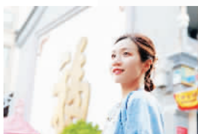
东门福字墙 潘家园东门进门处的福字墙并不简单。据了解，这个福字是康熙的御笔，也被称为天下第一福。