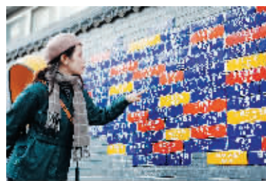
胡同印象 “复古”国潮“胡同文化”，如果您想寻找这样的地方，潘家园胡同印象不容错过。

靠滤镜撑颜值的地标数不胜数，但你却可以永远相信潘家园。瓷器墙、夜市、非遗文化街、山行市集……潘家园网红打卡动线上来啦！跟着攻略走，这些地方不靠滤镜也能出大片！全新的打卡动线以潘家园北门影壁墙为起始点，途经香潘潘美食街区、非遗文化街、潘家园故事墙、胡同印象、密室寻宝、山行市集、瓷器墙等地，最终到达潘家园礼物店。全程下来，既能感受到潘家园的新业态，品味美食、体验传统文化与新潮文化，还能打卡特色区域，感受专属于潘家园的魅力。