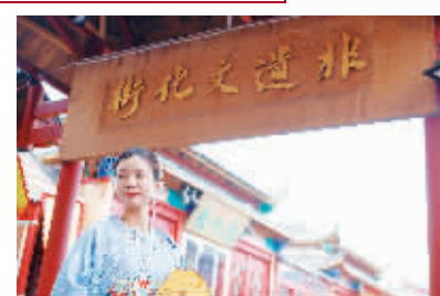
非遗文化街 藏在潘家园旧货市场中的非遗小店“小身材大内涵”值得看、值得买、值得学。集现场制作、展示、销售于一体，让非遗与游客零距离。