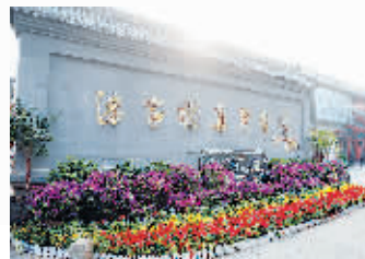
影壁墙 潘家园北门口的影壁墙可以说是必打卡的地点之一。影壁墙作为中国传统古建筑的重要组成部分，文化内涵深厚。