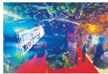
收藏品大厅 密室逃脱 于收藏品大厅打造的潘家园“密室逃脱”，是潘家园专属的场景体验项目，四大主题可让游客亲身体验“寻宝”的乐趣。

西地摊 古玩杂项、文玩、工艺品，品类齐全。据了解，这里每周四是跳蚤市场，汇集各种家居、二手商品；平日则是文玩杂项，好不热闹。