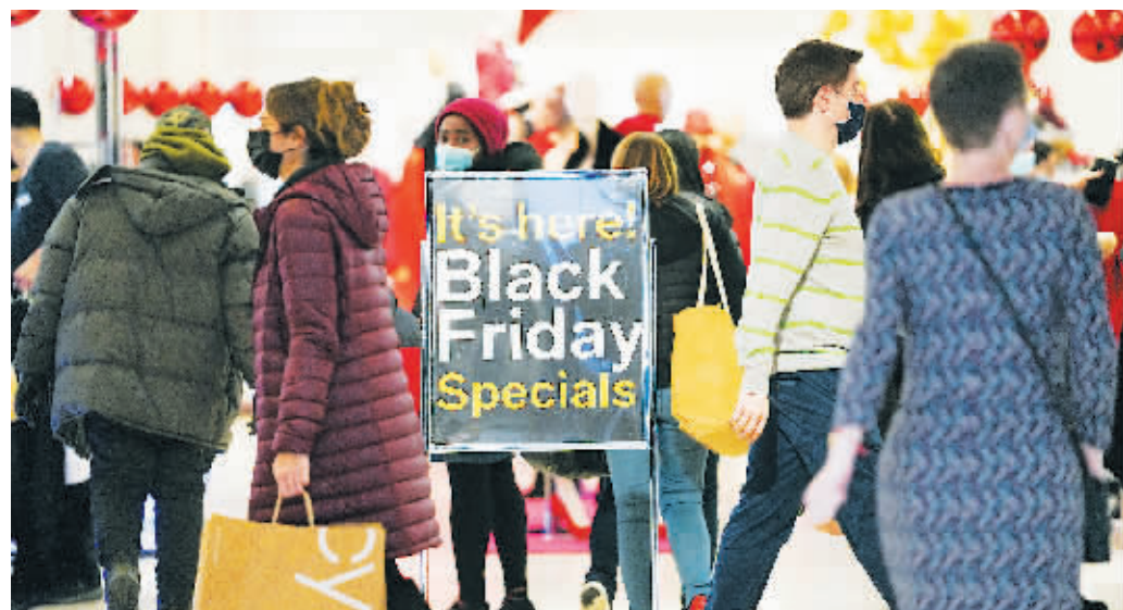
26日,人们在美国纽约梅西百货购物。

先讯美资全球零售咨询业务高级主管布赖恩·菲尔德指出:“黑五”当天,消费者的购物行为并没有因为一些国家出现新型变异毒株奥密克戎而受影响,不同州政府和社区针