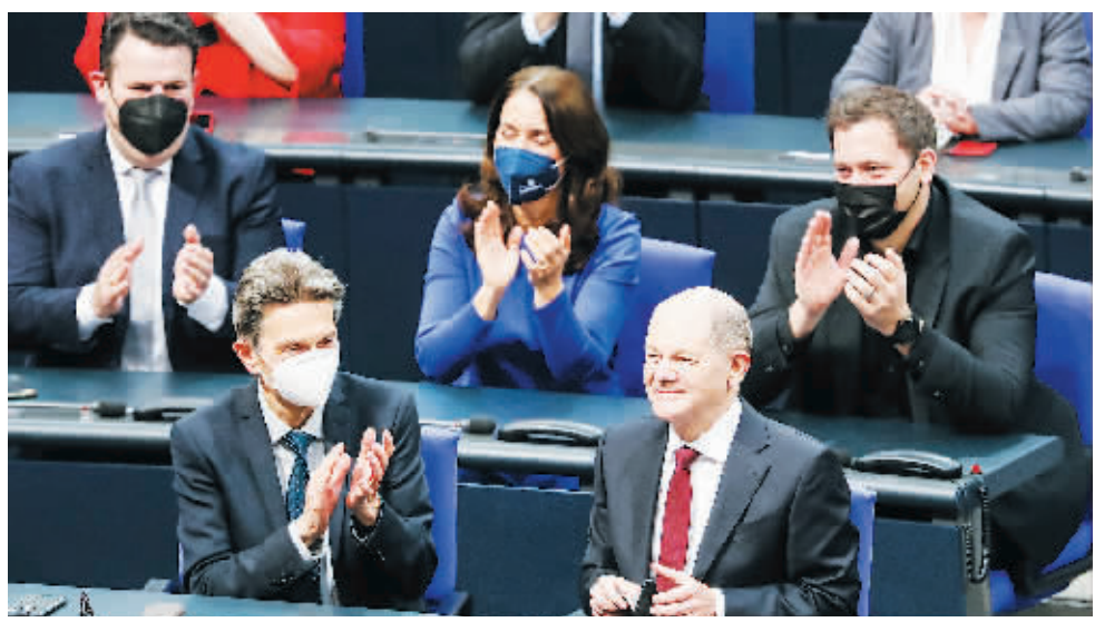
8日,在德国首都柏林的国会大厦,朔尔茨(前右)当选后接受祝贺。

强联合国在国际秩序方面发挥作用,支持多边主义和基于规则的国际秩序,支持联合国安理会改革,也将利用2022年德国担任七国集团轮值主席国的机会推进多边主义。新政府还将推动世贸组织发展,推动改善贸易争端解决机制。