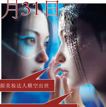
“柳夜熙”——一个会捉妖的虚拟美妆达人横空出世