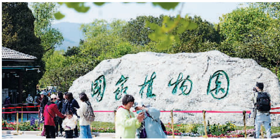
游客在国家植物园入口处参观

作为国家植物园体系的重要组成部分,国家植物园4月18日在北京正式揭牌。据悉,国家植物园是在中国科学院植物研究所和北京市植物园现有条件的基础上,经过扩容增效有机整合而成,总规划面积近600公顷。国家植物园方面表示,未来还将同上百个国家的植物园和专业机构建立合作关系,搭建国际综合交流分享合作平台,努力建设中国特色、世界一流的国家植物园。