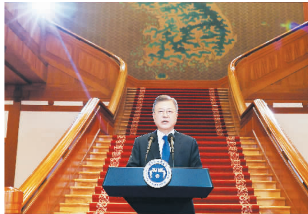
当地时间2022年5月9日,韩国首尔,韩国总统文在寅在青瓦台发表卸任演说。

当地时间9日上午,韩国总统文在寅在青瓦台发表卸任讲话,称自己终于卸下总统的重担,重返平凡公民的生活,祝愿每一位国民生活幸福。他还呼吁新政府继承发展往届政府积累的成果,续写大韩民国的成功历史。