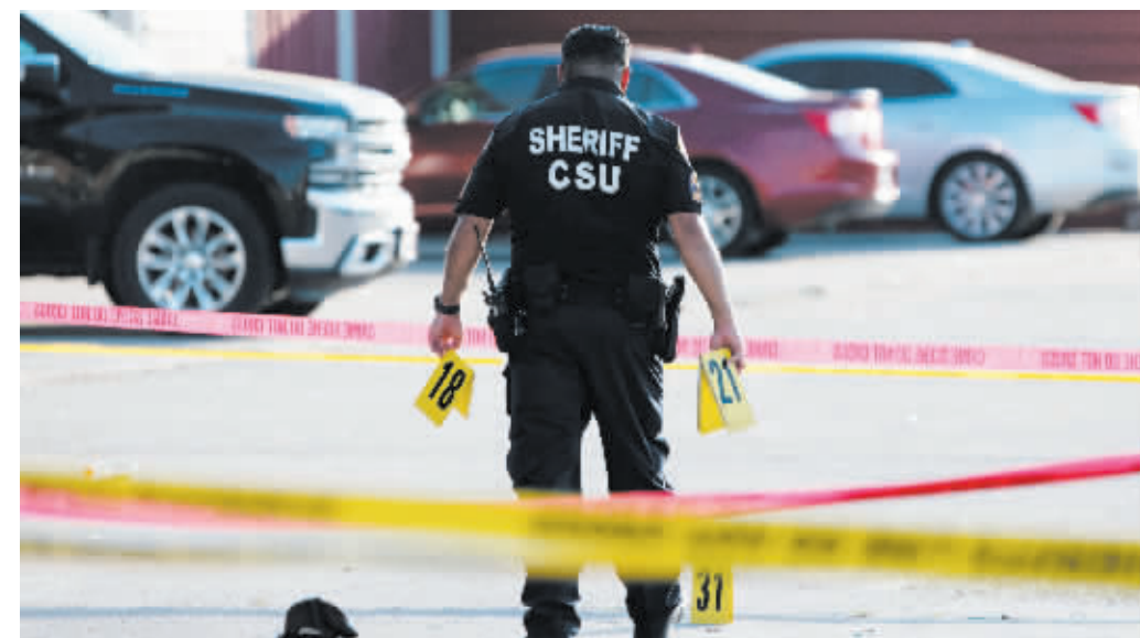
15日,在美国得克萨斯州休斯敦市,一名警察在跳蚤市场枪击事件现场工作。

过去几天内,美国多地发生枪击事件,导致近20人死亡。据非营利组织“枪支暴力档案”网站15日发布的最新数据,今年以来,美国国内涉枪事件已导致15979人丧生,13173人受伤。