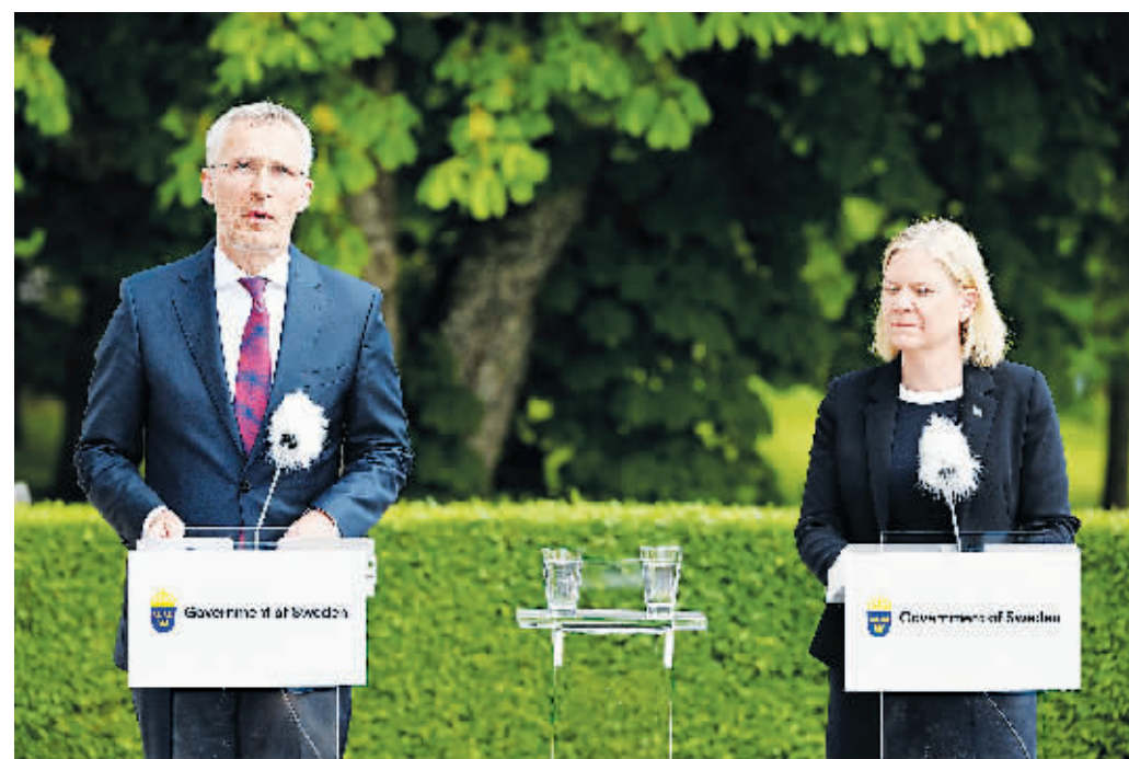
13日，瑞典首相安德松(右)与北约秘书长斯托尔滕贝格在瑞典哈普松德首相夏季庄园出席新闻发布会。

北约秘书长斯托尔滕贝格13日在瑞典表示，瑞典和芬兰申请加入北约的流程比预期复杂，两国获准入约的具体时间“无法确定”。