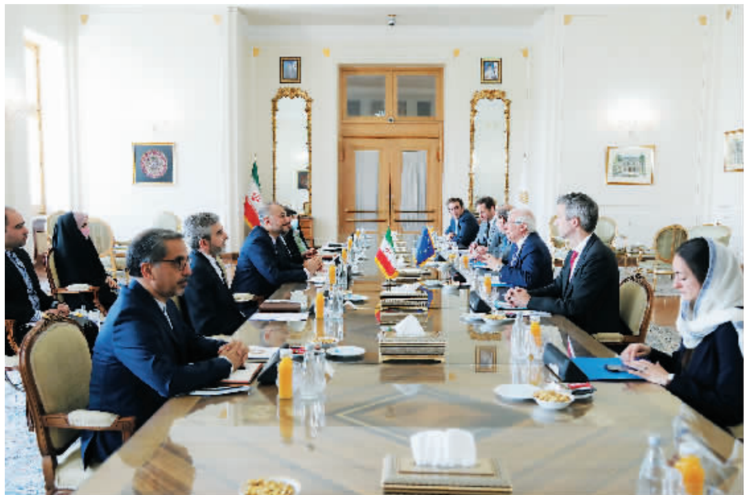
25日,伊朗外长阿卜杜拉希扬在德黑兰和欧盟外交与安全政策高级代表博雷利举行会晤。

伊朗外长阿卜杜拉希扬和欧盟外交与安全政策高级代表博雷利25日在伊朗首都德黑兰宣布,伊朗核问题全面协议相关方谈判将在数天内重启。