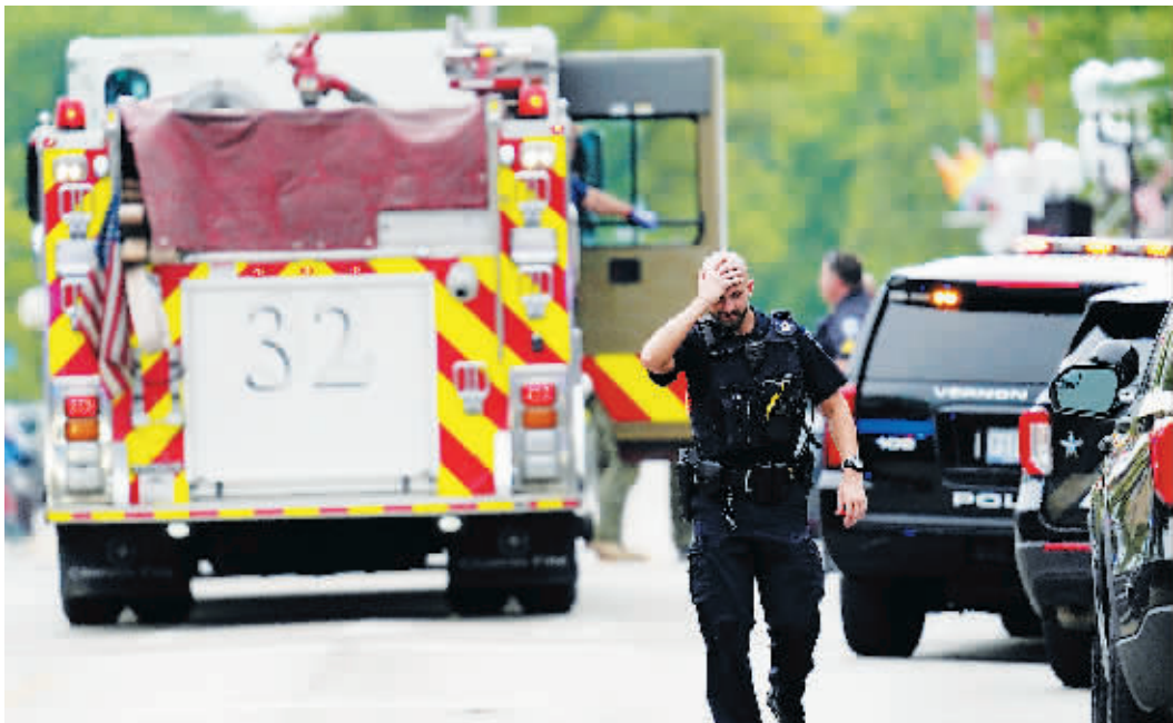
4日,一名警察走在枪击事件发生后的美国伊利诺伊州海兰帕克市街头。

美国中部伊利诺伊州海兰帕克市警方4日宣布,当天发生的“独立日”游行枪击事件犯罪嫌疑人已被捕。