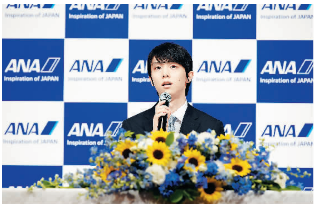
19日，羽生结弦在发布会上。

日本花样滑冰运动员羽生结弦19日在东京召开新闻发布会宣布退役。他表示，今后将不再参加竞技比赛，而转战职业花样滑冰领域。他还表示，将继续挑战四周半跳。