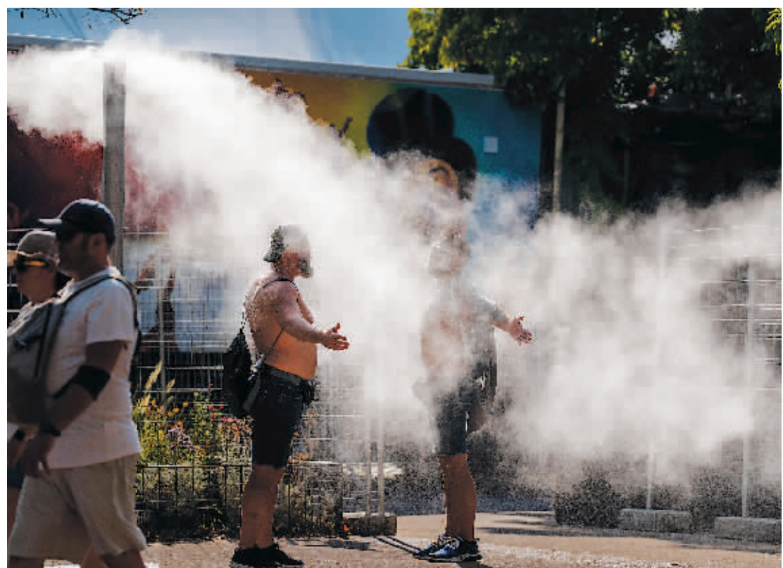
两名男子站在西班牙巴塞罗那街头的喷水装置下。

世界气象组织19日说，席卷欧洲的热浪将持续至下周中，这种高温天气未来或成欧洲夏季“标配”，高温等气候变化负面影响将至少持续至本世纪60年代。