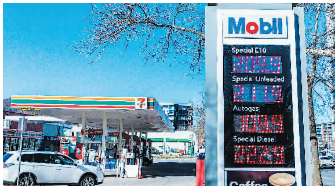
27日在澳大利亚堪培拉一个加油站拍摄的油价显示屏。

澳大利亚统计局27日发布的数据显示，今年二季度澳消费者价格指数(CPI)环比增长1.8%，同比增长6.1%，同比增幅再创2001年以来新高。