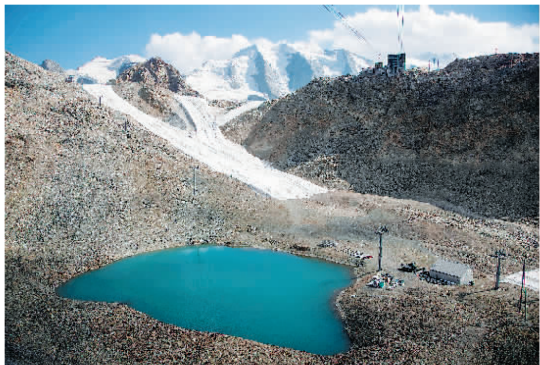
位于瑞士达特雷西纳的一处阿尔卑斯山脉滑雪场。

自去年冬天以来，阿尔卑斯山经历了两次初夏热浪。7月，瑞士西南部瓦莱州滑雪胜地采尔马特的气温接近30摄氏度，致使当地山脉雪线退至海拔5184米的高处，创历史新高，而夏季的正常雪线在海拔3000至3500米之间。