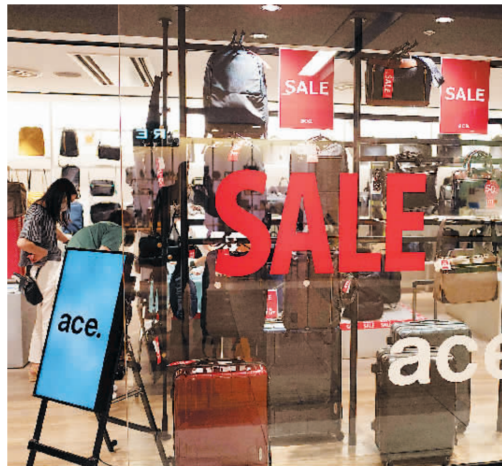
15日,民众在日本东京一处地下购物中心购物。

日本财务省17日公布的贸易统计结果显示,由于原油等进口商品价格高企以及日元大幅贬值,日本连续12个月出现贸易逆差,7月贸易逆差达1.44万亿日元(1美元约合134日元),创历史新高。