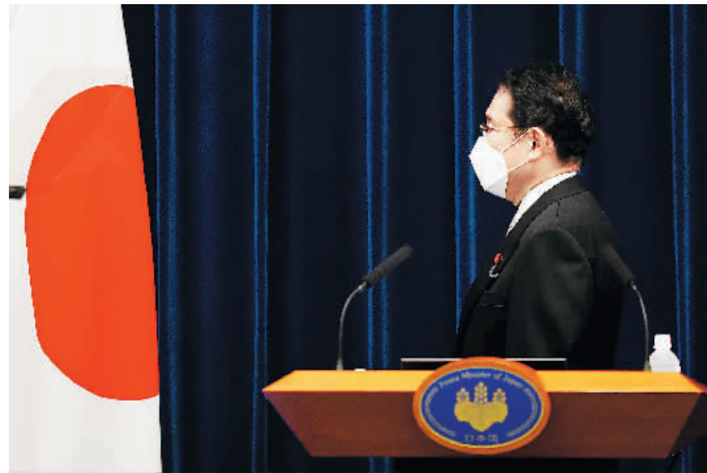
日本内阁官房8月21日下午发布消息说，日本首相岸田文雄确诊感染新冠病毒。

日本首相官邸21日发布消息称，首相岸田文雄感染新冠病毒。岸田当天检测结果呈阳性，目前正在疗养。据此前报道，岸田文雄于本月12日接种了第4针新冠疫苗。