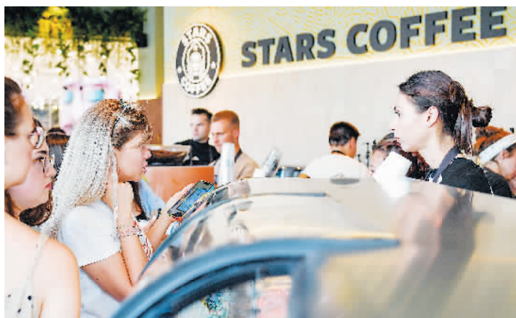
22日，人们在俄罗斯莫斯科一家“星咖啡”门店排队点餐。

随着西方对俄制裁蔓延到各个领域，俄罗斯人的生活发生了一些改变。麦当劳、可口可乐、星巴克、优衣库、H&M等品牌暂停经营或撤出俄罗斯市场，一些俄罗斯本土产品和服务纷纷涌现，逐步替代这些西方品牌。