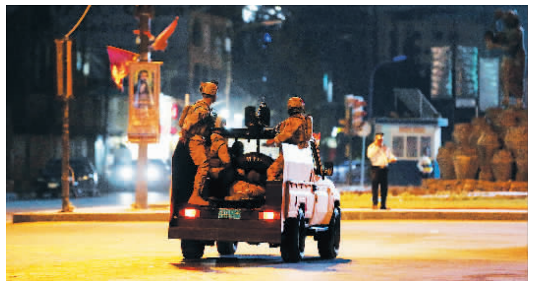
8月29日，在伊拉克首都巴格达，安全部队在宵禁后的街头巡逻。

因近期伊拉克示威活动频繁并引发流血冲突，伊拉克联合行动指挥部当地时间29日发表声明，宣布自当天起实施全国宵禁。