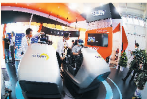
东方时尚驾驶学校展示VR智能驾驶培训模拟器,可实现科目二场地训练、科目三实际道路的初级训练。

在15.2万平方米的“一会双馆”服贸会现场,2400余家企业集中亮相新技术、新产品。大载荷无人直升机、航天贵金属文创产品、VR智能驾驶培训模拟器……2022年服贸会“黑科技”大晒场。