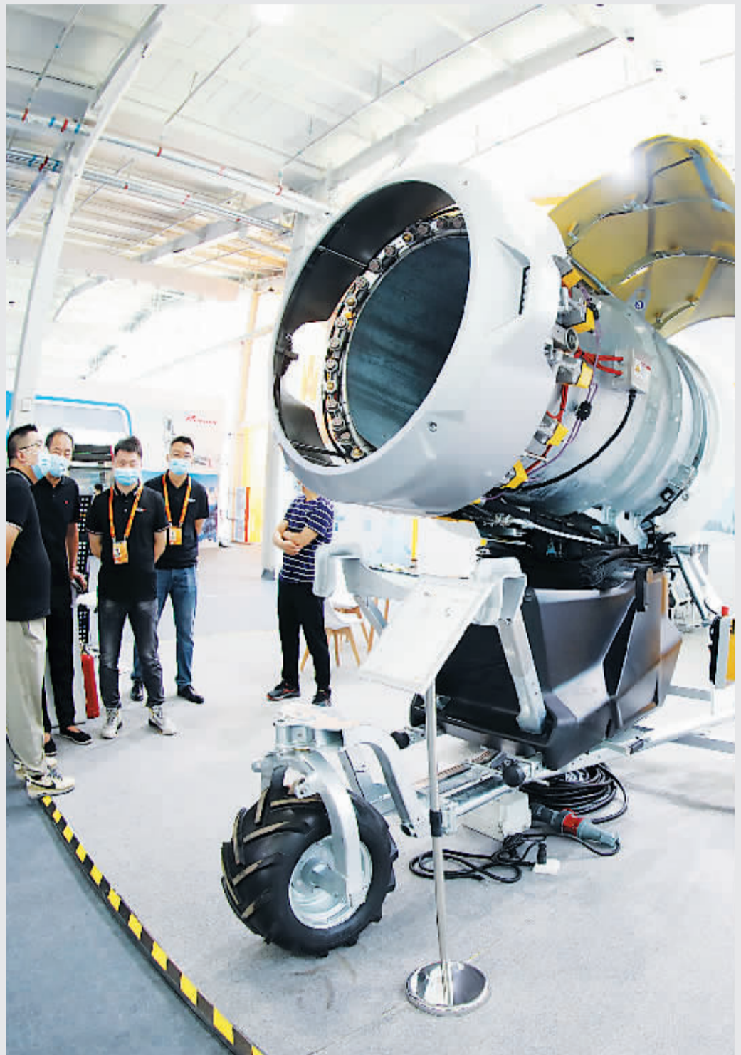
天冰全新TR10全自动炮式造雪机,展示全球最前沿的造雪科技。