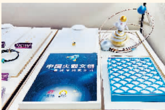
莱百股份与中国长征火箭有限公司、北京航天长征科技信息研究所合作研发航天领域贵金属文创产品