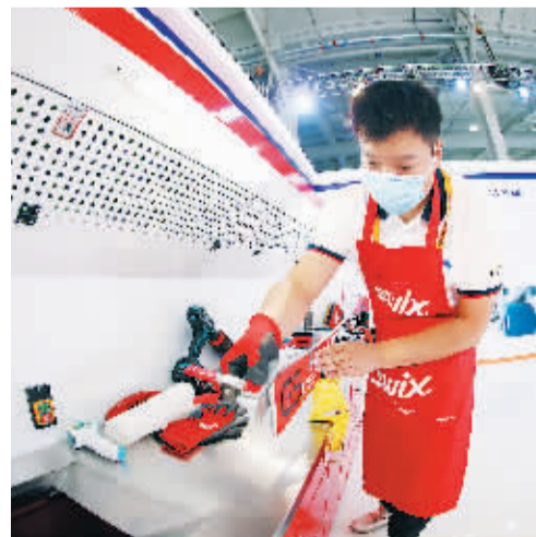
北京冬奥会期间谷爱凌专职打蜡师现场演示