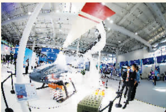
大载荷无人直升机亮相展台