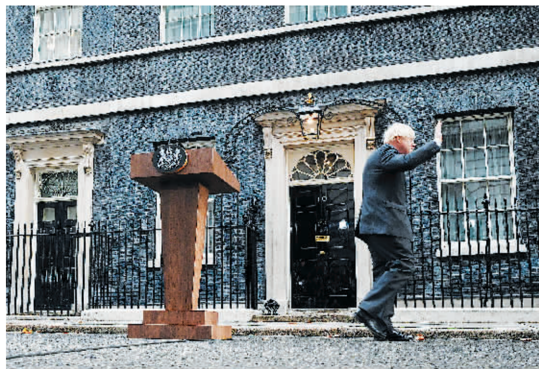
6日，英国伦敦，英国首相鲍里斯·约翰逊在唐宁街发表告别演说。

当地时间9月6日早上，约翰逊在唐宁街10号发表他作为首相的最后一次演讲。演讲中，约翰逊列举了他作为首相的成就，还对被迫离开唐宁街10号表示了不满。