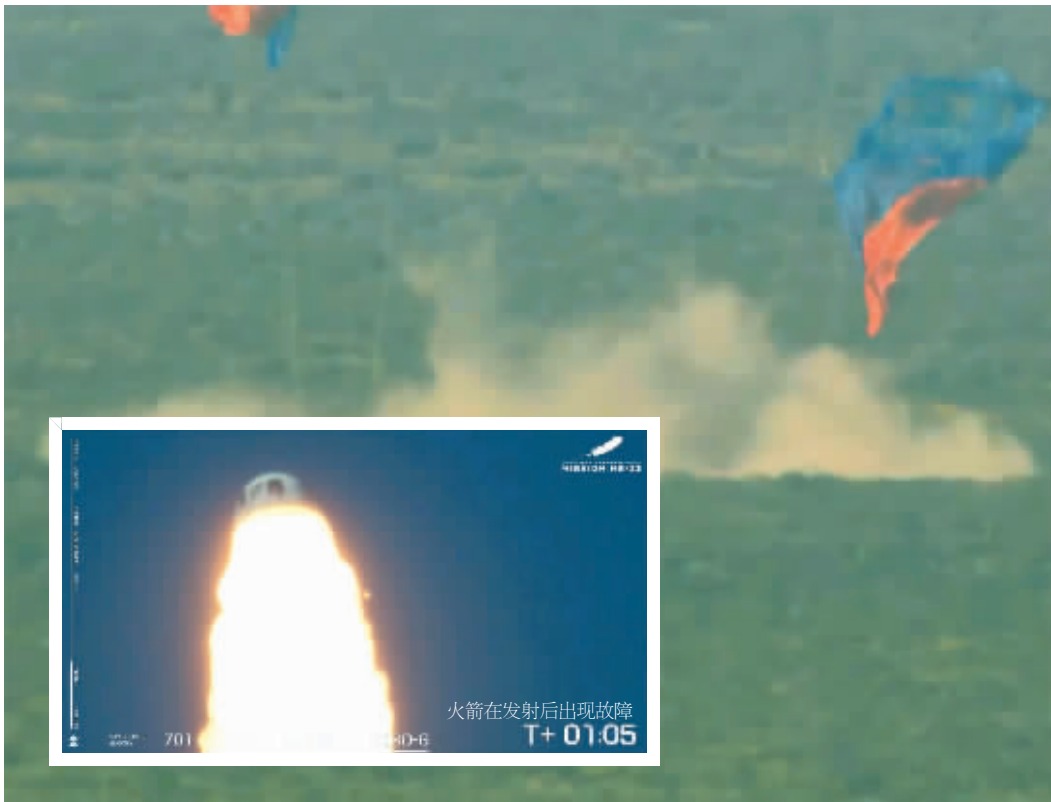
12日,在美国得克萨斯州西部,太空舱打开降落伞落回地面。

美国蓝色起源公司的“新谢泼德”飞行器12日进行不载人太空试飞,火箭在发射后出现故障并坠毁,没有造成人员伤亡。