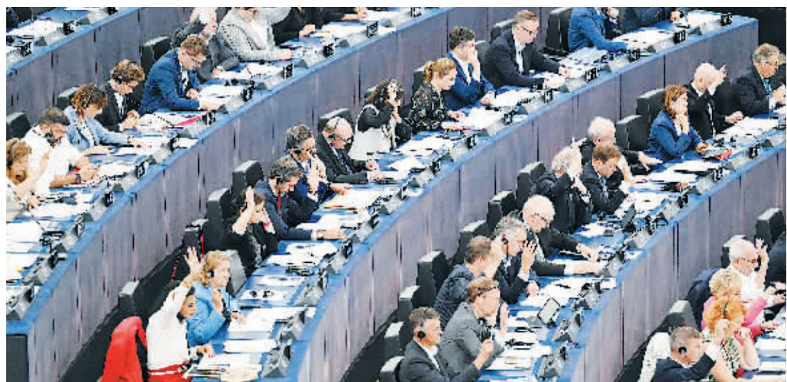
14日,在法国斯特拉斯堡,欧盟委员会就能源政策进行投票。

欧盟委员会14日提议对欧洲能源市场进行紧急干预,以缓解近期能源价格大幅上涨。此前备受关注的设置天然气价格上限的提议因争议较大未包括其中。