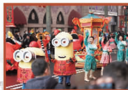
首个“环球中国年”季节性主题活动