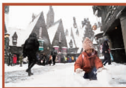
哈利波特魔法世界落下第一场雪