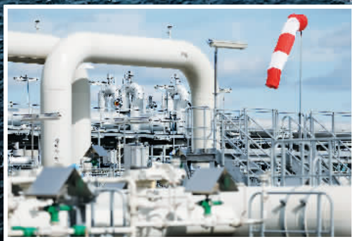
30日在德国卢布明拍摄的北溪-1天然气管道。

俄罗斯与欧盟的能源战再生变数。作为欧洲能源“大动脉”,北溪-1和北溪-2在24小时内被探测到爆炸并泄漏。在事件原因尚未查明之时,到底谁是幕后黑手,各方也众说纷纭,谜团重重。而对欧洲来说,这个冬天将会更难熬。因为即使有意愿重启北溪管道,也不太可能如愿进口到俄罗斯的天然气管道。