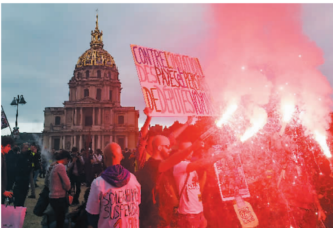
18日,法国巴黎,抗议者进行游行示威。