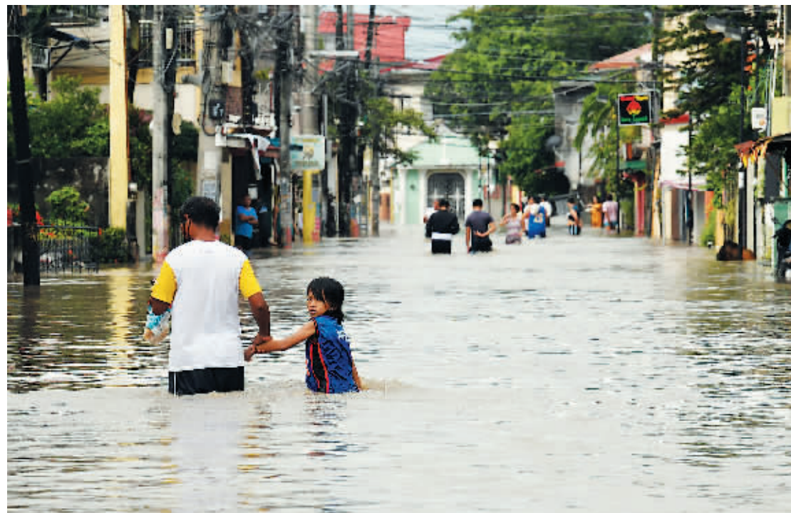
人们在菲律宾甲米地省被洪水淹没的街道上。

菲律宾国家减灾委员会3日通报说,热带风暴“尼格”引发的洪水和山体滑坡等灾害已造成全国150人死亡、128人受伤,另有36人失踪。