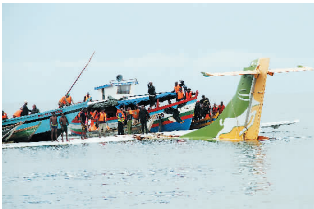
6日,救援人员在坦桑尼亚中盖拉省的维多利亚湖中搜救。

坦桑尼亚总理马贾利瓦6日说,一架客机当天在坦桑尼亚西北部卡盖拉省的维多利亚湖坠机,遇难人数已升至19人。马贾利瓦当天视察了坠机现场。