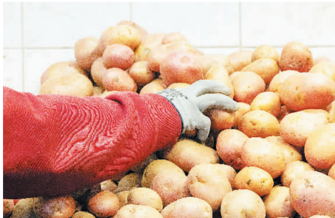
匈牙利土豆和鸡蛋价格大幅上涨。

匈牙利总理府部长古亚什9日宣布，政府决定将鸡蛋和土豆列入受价格上限保护的食品清单。古亚什在当天举行的新闻发布会上说，土豆和中号鸡蛋价格将不超过9月30日的水平。