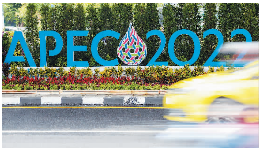
泰国首都曼谷街头2022年APEC会议标识。

紧随二十国集团(G20)巴厘岛峰会之后，亚太经济合作组织(APEC)第二十九次领导人非正式会议将于11月18日-19日在泰国曼谷举行，这是时隔4年APEC会议再次于线下举行。届时，来自21个经济体的领导人、代表以及特邀嘉宾，将面对面商讨区域经济发展相关议题。与此同时，与会各方也将在会议期间开展双边及多边外交。