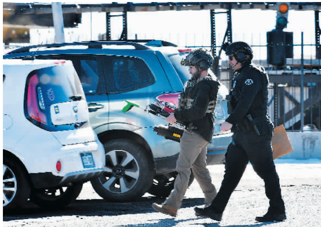
20日,在美国科罗拉多州科罗拉多斯普林斯市,警方人员在发生枪击事件的夜店外进行调查。

美国科罗拉多州科罗拉多斯普林斯市的一家夜店19日深夜发生枪击事件,已造成至少5人死亡,另有25人受伤,受害者目前仍在当地医院进行救治。