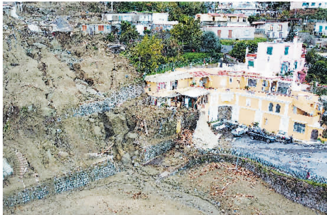
27日在意大利伊斯基亚岛卡萨米乔拉拍摄的受损的房屋。

意大利南部著名旅游胜地伊斯基亚岛26日发生山体滑坡后,已造成至少3人死亡、13人受伤。