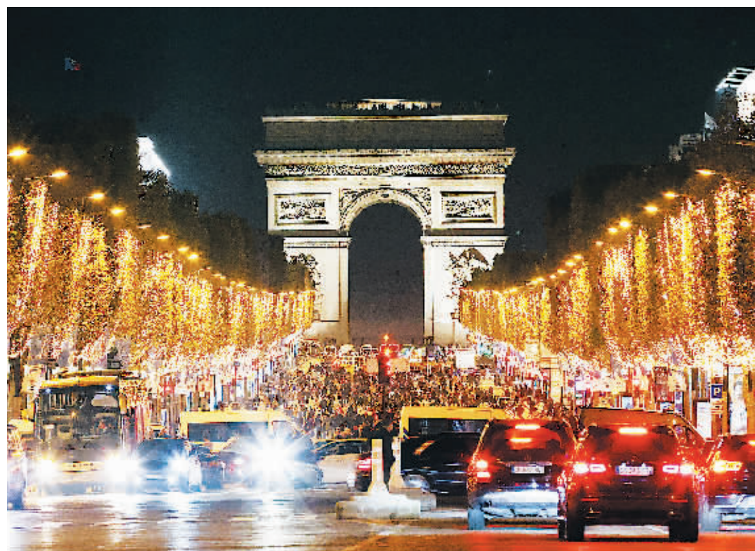
法国巴黎香榭丽舍大街被装饰的灯光点亮。受能源危机影响，今年的亮灯活动与往年相比将提前一周结束。

随着冬季寒冷天气的到来，因整体用电需求上涨而供应不足，法国下周或面临停电风险，可能影响60%的法国人口。