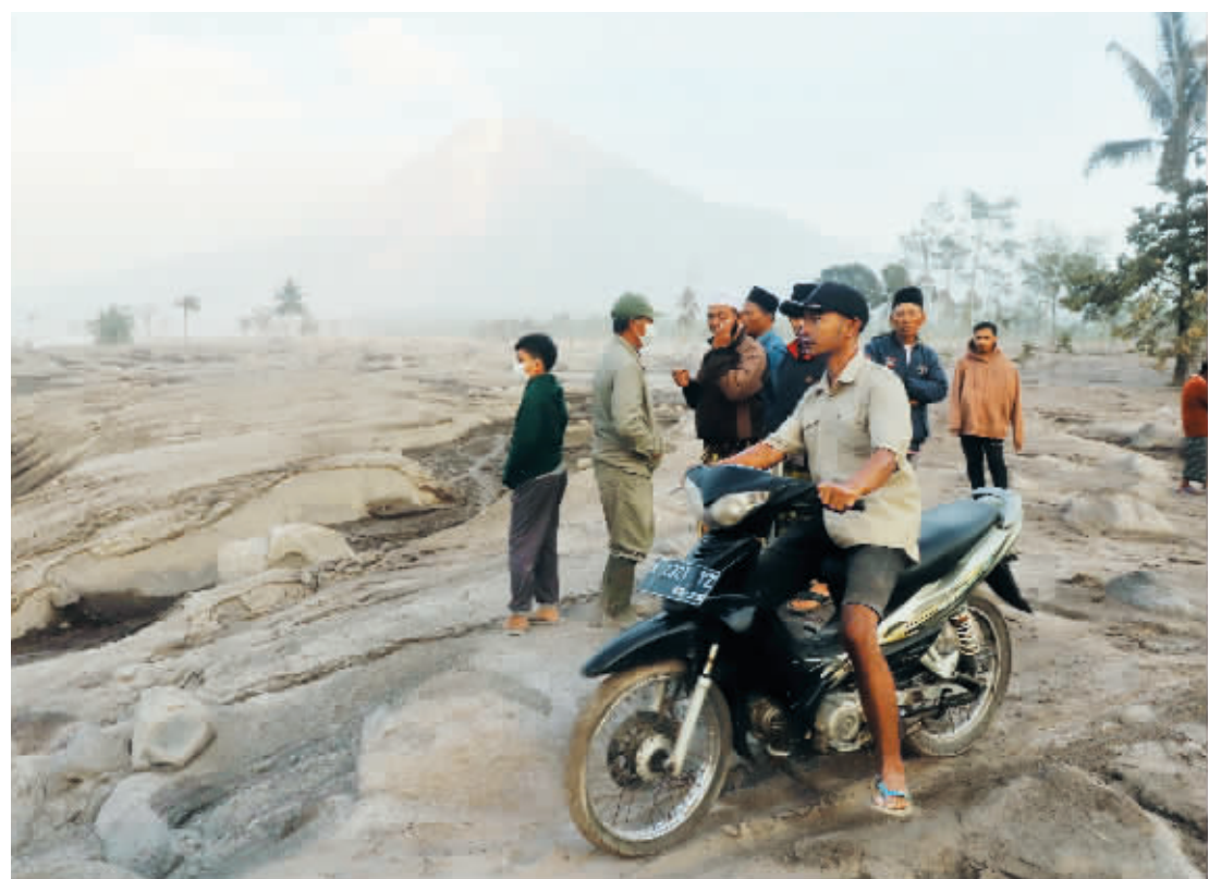
5日，在印度尼西亚爪哇省卢马姜，当地居民查看受灾情况。

印度尼西亚国家抗灾署4日说，东爪哇省塞梅鲁火山当天剧烈喷发，印尼火山监测部门已将火山警戒级别提升至最高级。目前已有近两千名当地民众被紧急疏散。