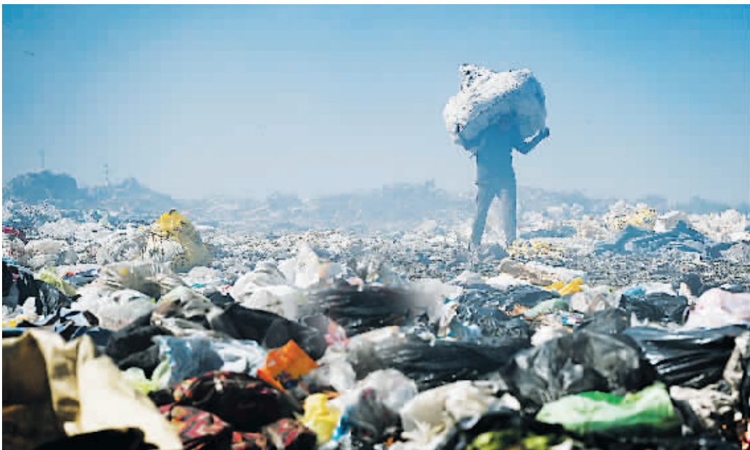
12月5日,一名男子在阿根廷卢汉的垃圾场搬运垃圾。

国际货币基金组织(IMF)日前表示,已与阿根廷政府就其债务再融资计划第三次评估达成协议,阿根廷有望获得约60亿美元IMF贷款。