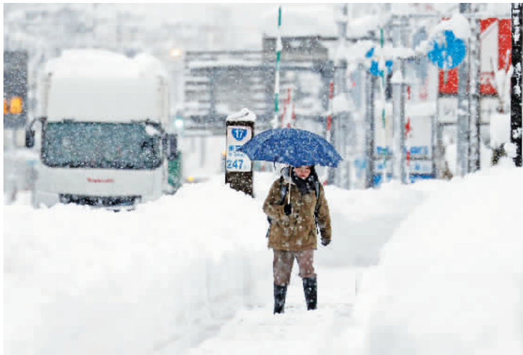
一名女子在日本新潟县冒雪出行。

自12月17日起，日本多地出现历史性强降雪，一些地区积雪厚度超过1.6米。据日本总务省消防厅统计，截至当地时间26日8时30分，大雪已造成北海道、青森县、秋田县、山形县、新潟县、石川县、爱媛县等地区共17人死亡，93人受伤。受降雪影响，部分地区出现通信故障，数以万计家庭停电，多条铁路停运，多个航班延误。