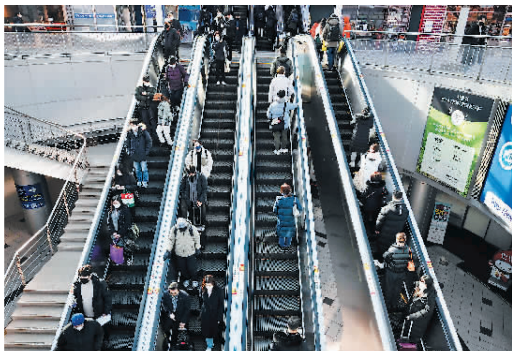
当地时间2023年1月30日，韩国取消室内戴口罩规定，但许多人仍然选择戴口罩。

据韩联社报道，韩国政府自当地时间30日起解除室内佩戴口罩义务，但公共交通工具、医疗机构等部分疫情感染高危场所例外。