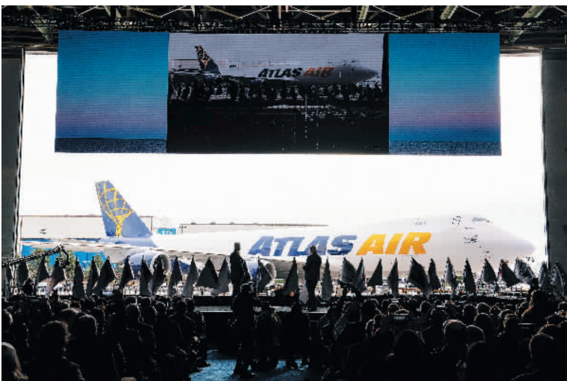
1月31日在美国华盛顿州埃弗里特市拍摄的波音公司交付最后一架商用747系列飞机的仪式现场。

当地时间1月31日,波音、阿特拉斯航空与包括前任和现任员工、客户、供应商在内的千名嘉宾共同庆祝了最后一架747飞机的交付,标志着这一机型半个多世纪生产历史的结束。