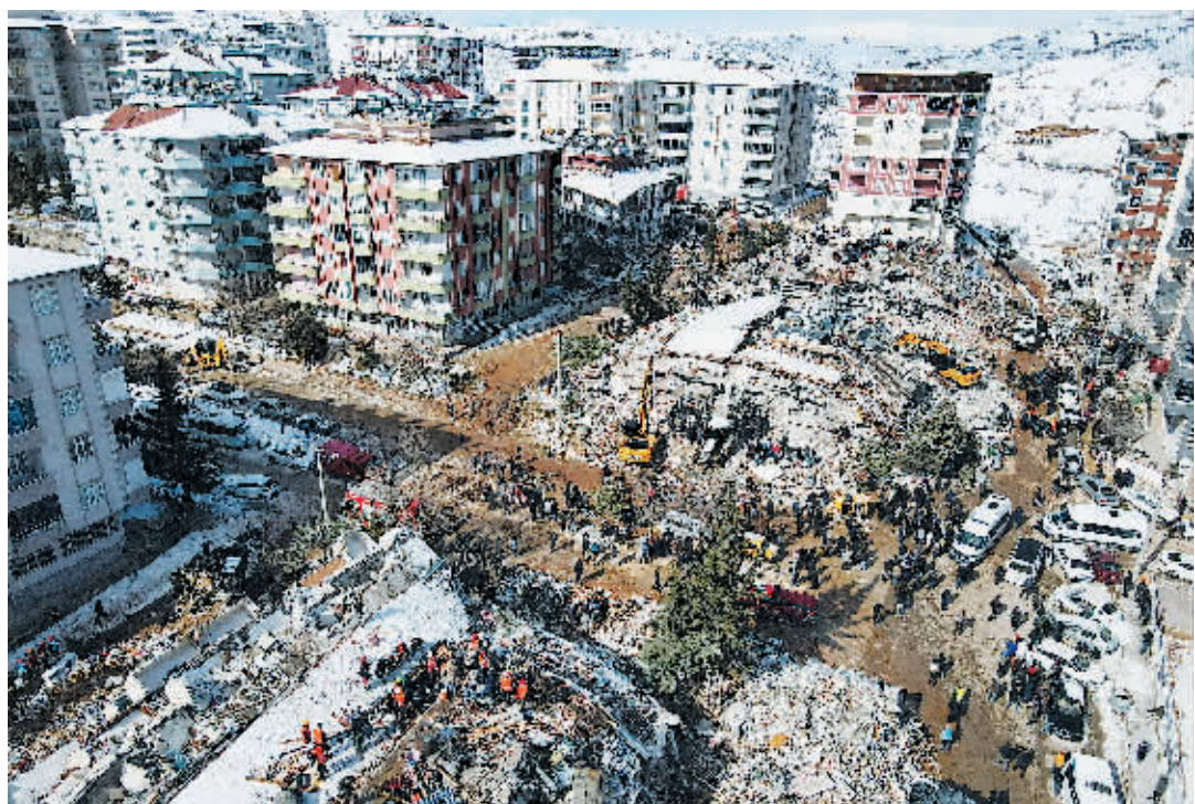
8日,在土耳其阿迪亚曼省贝斯尼,救援人员在地震废墟搜救(无人机照片)。

意大利国家地球物理学与火山学研究所所长卡洛·多廖尼日前对意大利媒体表示,根据数字模型分析发现,土耳其南部靠近叙利亚边境地区发生强烈地震后,叙利亚所在的阿拉伯板块相对土耳其大部分国土所在的安纳托利亚板块位移超过3米。