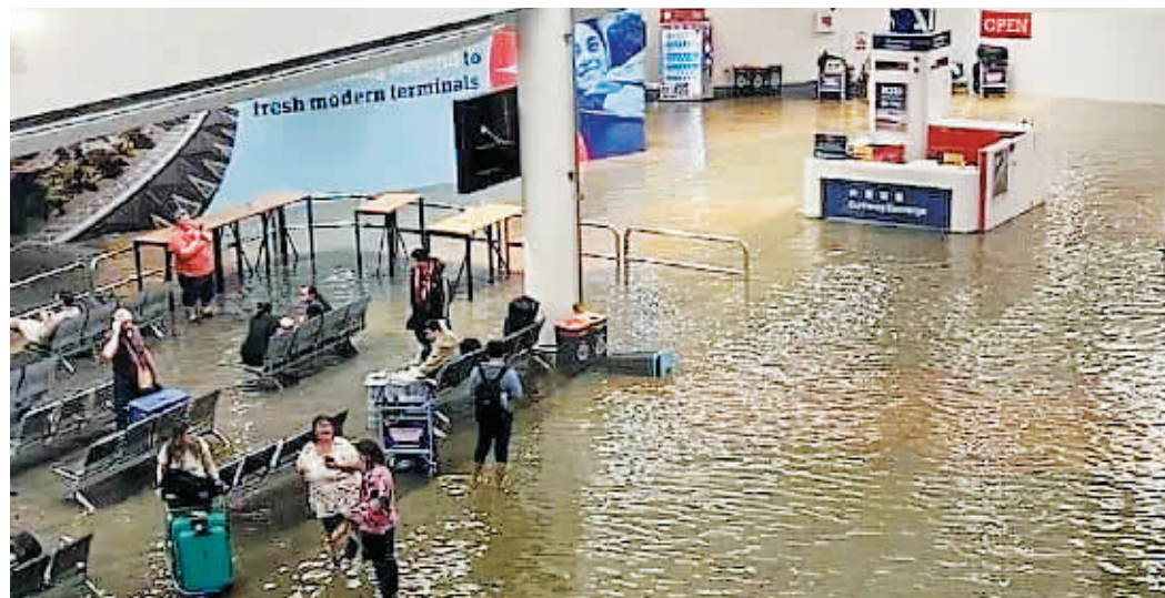
1月27日,新西兰奥克兰国际机场国际出发航站楼遭洪水侵袭。

当地时间12日,随着飓风“加布里埃尔”逼近,新西兰北岛多地迎来降雨,并逐步加剧。奥克兰市内火车以及轮渡服务都已经取消,海港大桥关闭。