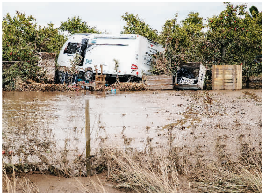
新西兰霍克斯湾受灾景象。

新西兰气象局最新天气预报显示,因飓风“加布丽埃尔”受灾严重的新西兰北岛部分地区23日将再迎强降雨。