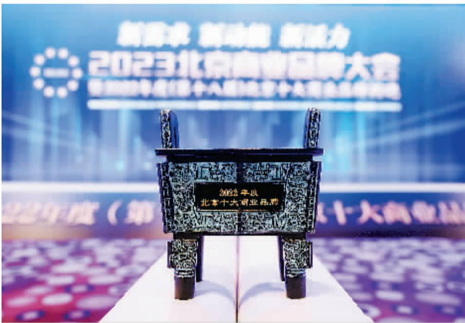
沉甸甸的青铜鼎不仅是一份荣誉,更是一种责任。