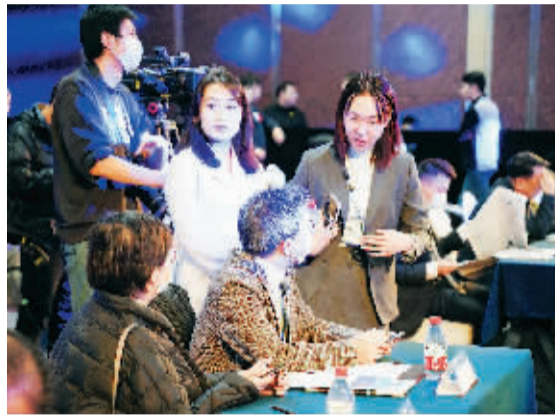
企业嘉宾们正在现场进行签到、接受采访。