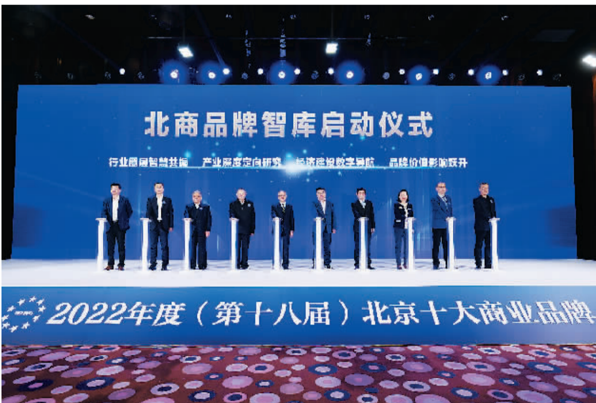
“深蓝·北商智库”正式亮相。