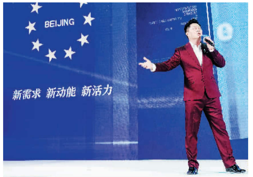
北京十大商业品牌活动主题曲《问鼎辉煌》在现场正式发布。