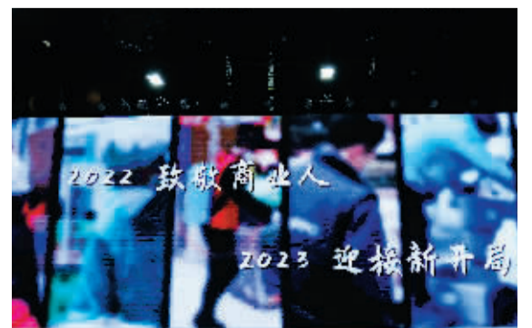
现场播放北京商报团队制作的《北京商业的24小时与365天》。