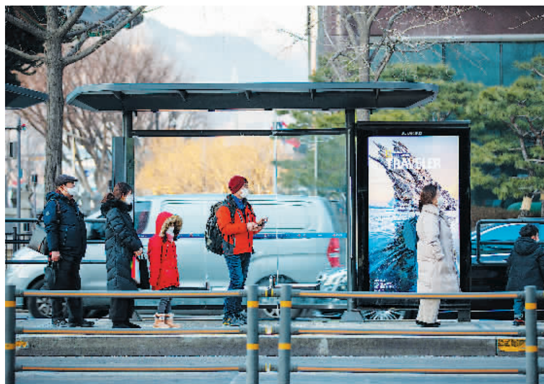
人们佩戴口罩在韩国首尔等候公交车。

据韩联社，韩国政府从3月20日起不再强制要求公众在公共交通工具，或在设于大型公共场所内的开放式药店时佩戴口罩，但普通药店除外。