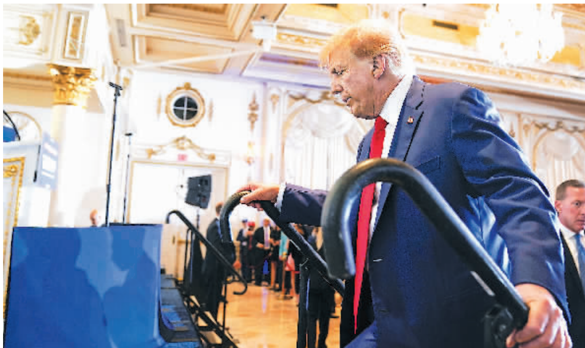
4日,美国佛罗里达州棕榈滩,美国前总统特朗普在海湖庄园发表演讲。当天早些时候,他在纽约被起诉。

美国前总统特朗普4日下午在纽约州纽约市出庭应诉,成为美国历史上首位被刑事起诉的前总统。美国专家和媒体认为,特朗普刑事案凸显并加深美国政治和民意撕裂。