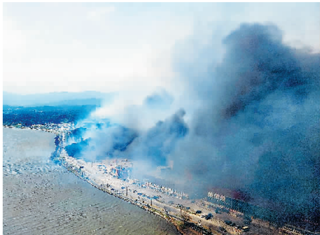
11日在韩国江原道江陵市拍摄的山火现场。

韩国山林部门当地时间11日消息称,当天在江原道江陵发生的山火因强风蔓延至海岸地区,目前仍朝北扩散,火势难控。受此影响,数百居民被迫疏散。