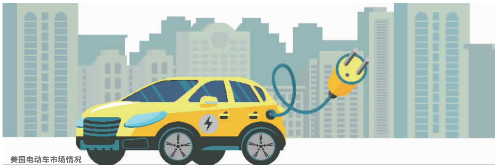
美国电动车市场情况